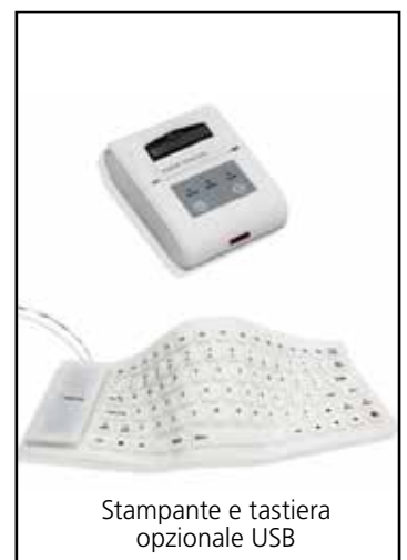
Stampante e tastiera opzionale USB