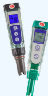
pH-COND-PC-ORP Tester a tenuta stagna