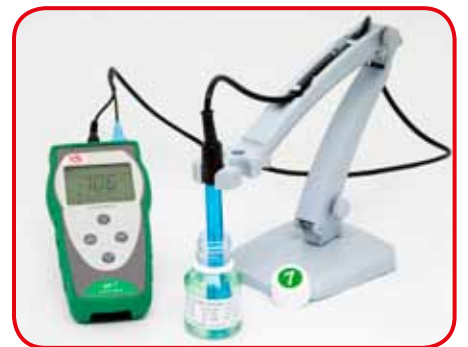
Supporto per utilizzo su banco (opzionale)