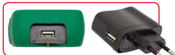
Uscita USB per scarico dati ed alimentazione tramite PC o alimentatore a rete fornito di serie