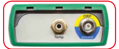
Connettori di collegamento sonde