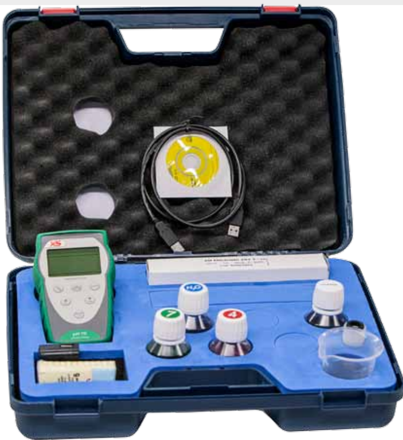
Valigia di trasporto completa di accessori, utile per essere usata come laboratorio portatile