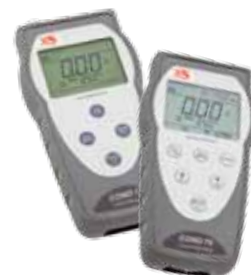
Serie Conducibilità COND 7 - COND 70