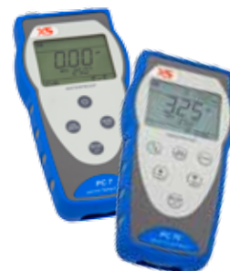
Serie Multiparametro PC 7 - PC 70