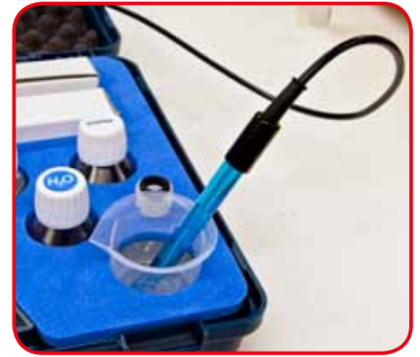
Campione in misura alloggiato nella valigia per evitare accidentali ribaltamenti