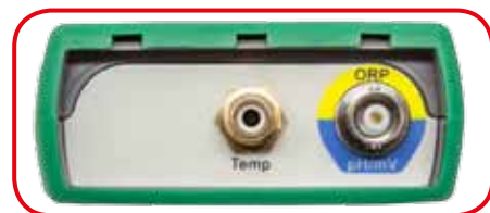
Connettori di collegamento sonde