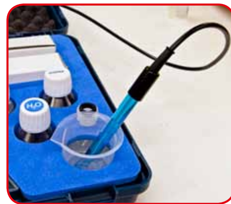
Campione in misura alloggiato nella valigia per evitare accidentali ribaltamenti