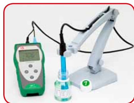
Supporto per utilizzo su banco (opzionale)