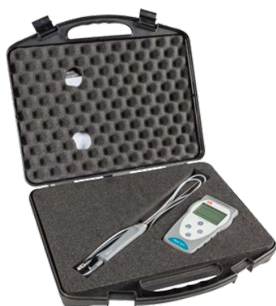
Temp 7 NTC Kit

Il termometro Temp 7 NTC è la scelta ideale per le misure veloci in un campo ristretto di lavoro.