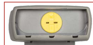
Ingresso sonda termocoppia K e T