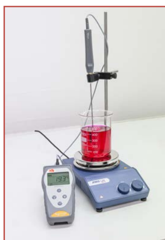
Misura della temperatura di liquidi