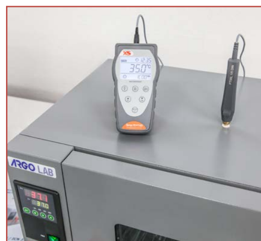
Controllo della temperatura di un incubatore