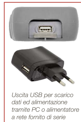
Uscita USB per scarico dati ed alimentazione tramite PC o alimentatore a rete fornito di serie

Se usato in abbinamento con la sonda PT56L 1/5 DIN è ideale come strumento primario