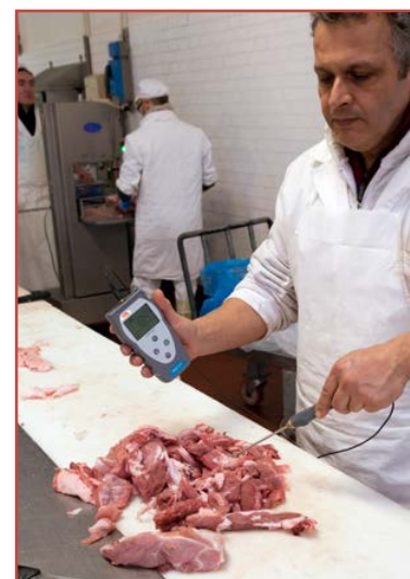
Misure nel settore alimentare

La versione completa di sonda per liquidi ed aria e la comoda valigetta di trasporto viene proposta ad un prezzo economico.