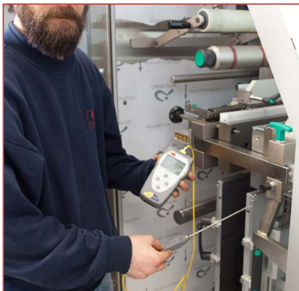
Misure nel settore industriale

L'ingresso predisposto per termocoppie K e T lo rende molto flessibile per applicazioni nel campo industriale e nel campo farmaceutico dove le termocoppie tipo T garantiscono una maggiore precisione della misura.