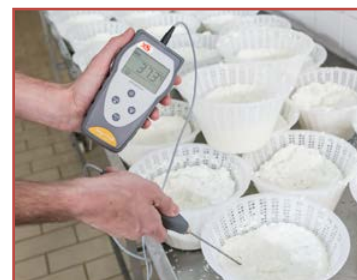
Ottimo per il settore alimentare