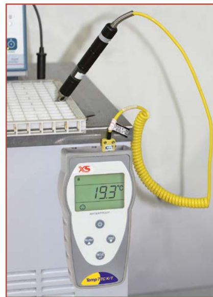
Misure in laboratorio