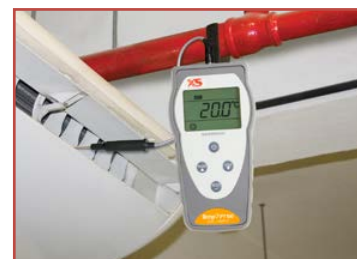
Misura della temperatura in sistemi di condizionamento

Studiati ergonomicamente per una comoda operatività con una sola mano. La superficie nervata assicura una presa sicura prevenendo scivolamenti durante l'uso.