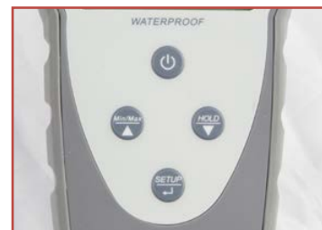
Tastiera a prova di schizzi