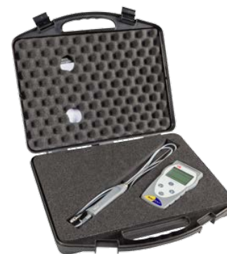
Valigia di trasporto

Il termometro Temp 7 K/T per sonde termocoppia K e T è lo strumento robusto e facile da usare, che grazie al suo ampio display, permette una lettura chiara ed una misura accurata.