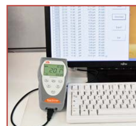
Collegamento a computer

Il termometro Temp 70 Pt100 datalogger è la scelta ideale per misure veloci, accurate e altamente precise in un ampio range di temperatura. Robusto e facile da usare, il Temp 70 Datalogger è dotato di un ampio display LCD retroilluminato per dare letture chiare e ben visibili, anche in ambienti poco luminosi.