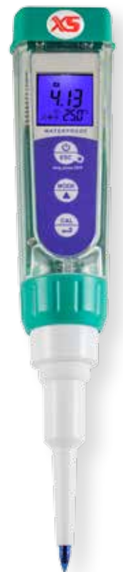
pH 5 FOOD