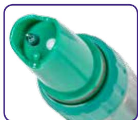
ORP 51 elettrodo di ricambio per ORP 5