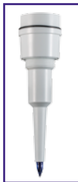
SPH 51 elettrodo FOOD di ricambio per pH 5 FOOD