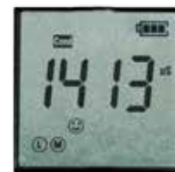
Display COND 1