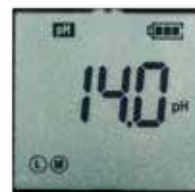
Display pH 1