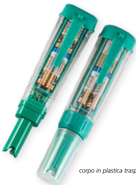
corpo in plastica trasparente