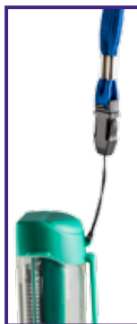
Cordino da collo