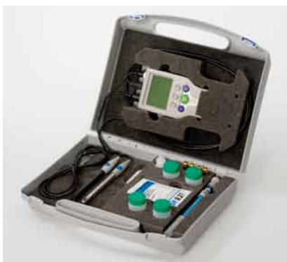
Field Compact Case