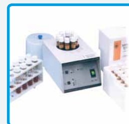
Termoreattore per analisi COD