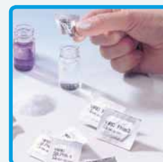
Reattivi in polvere Vario