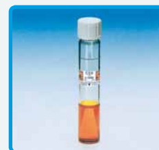
Provetta "pronta all'uso" per analisi COD