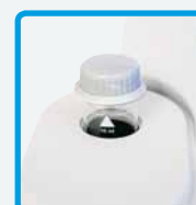
Particolare del vials parzialmente inserito, con tappo a tenuta di luce