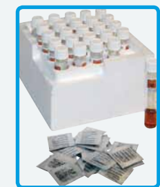
Bustine di reattivi Vario e confezione di provette per COD