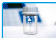
Vials per l'analisi del campione

I metodi sono regolarmente aggiornati secondo le esigenze del mercato. E' possibile trovare software e nuovi metodi sul sito del produttore www.aqualytic.de