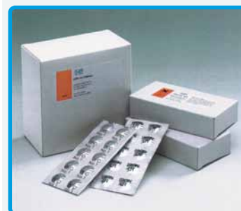
Comprese preosate in blister protettivo in alluminio