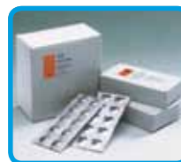
Compresse predosate in blister in alluminio