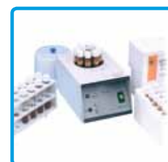
Termoreattore per analisi COD