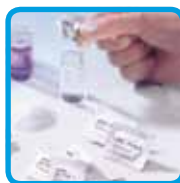
Reattivi in polvere Vario