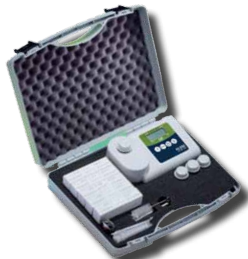
Fotometro con valigia di trasporto