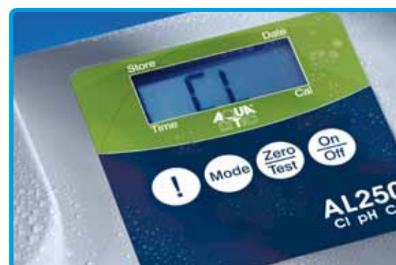
Particolare della tastiera a tenuta stagna