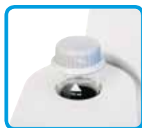
Vials con tappo a tenuta di luce