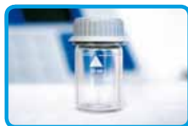
Vials per l'analisi del campione