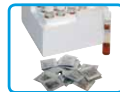
Bustine di reattivi Vario e provette per COD