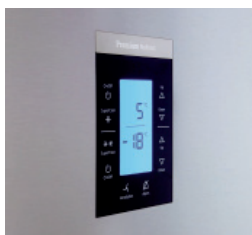
Pannello di controllo