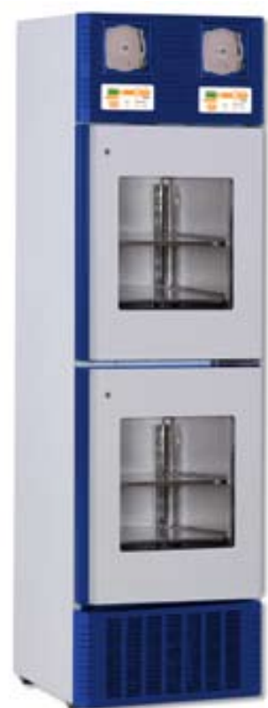
V41/2 con registratori grafici