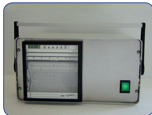
Registratore di temperatura

DH411 Guanti mezzo braccio Cryo Gloves taglia L