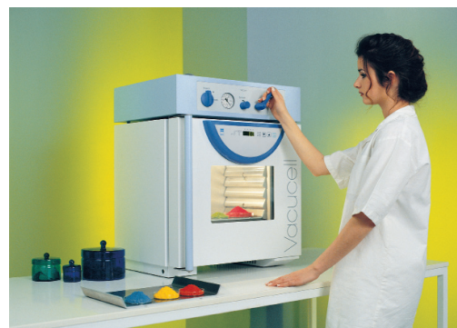
VVCell 22 standard blue line MMM