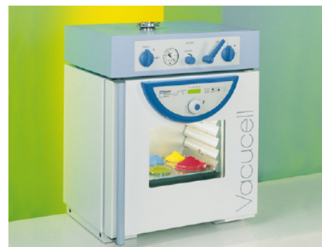
VVCell 55 standard blue line MMM

acciaio inox mat. No. 1.4301 (AISI 304) e alluminio