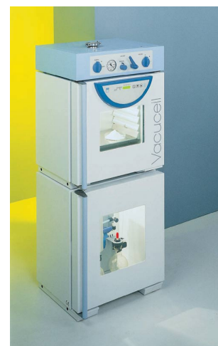
VVCell 55 standard blue line MMM