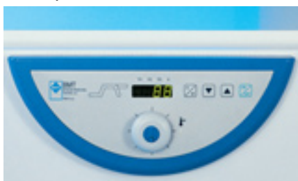
Gestione con microprocessore fuzzy logic

Per il migliore controllo della temperatura all'interno della camera, la gestione avviene con microprocessore di controllo