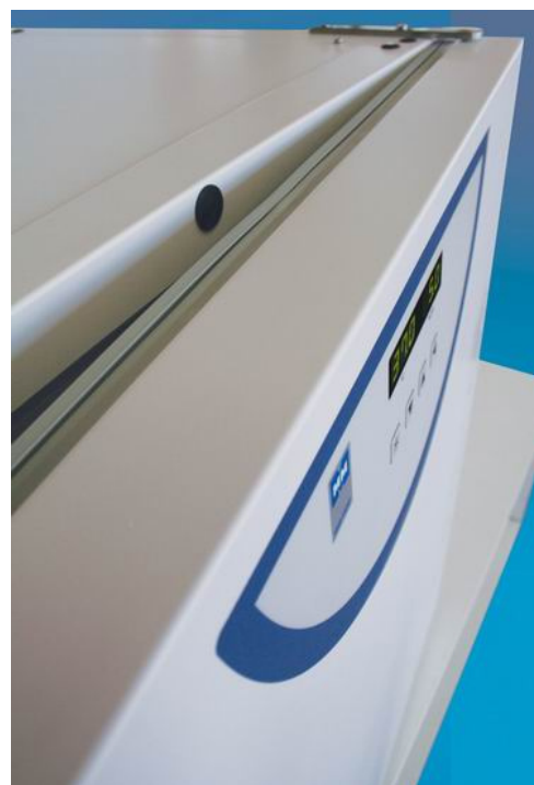
CO2Cell 170 standard MMM