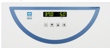
Gestione con microprocessore

Per il migliore controllo della temperatura all'interno della camera, la gestione avviene con microprocessore di controllo PID.