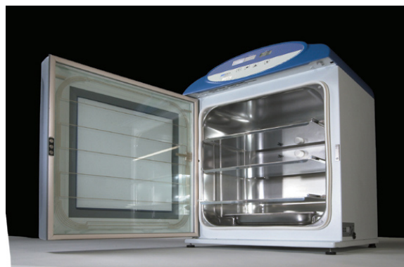
CO2Cell 248 standard MMM