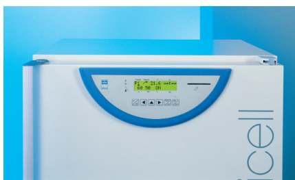
Gestione con microprocessore fuzzy logic

Per il migliore controllo della temperatura all'interno della camera, la gestione avviene con microprocessore di controllo