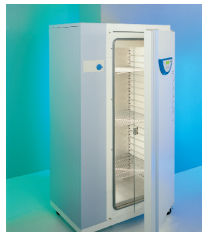
ClimaCell 404 standard MMM