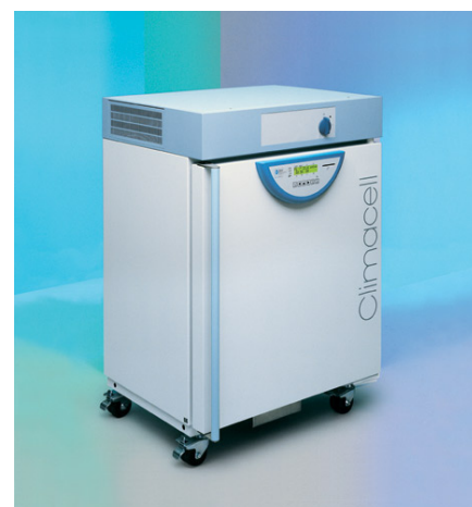
ClimaCell 111 MMM